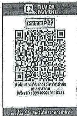
สแกน QR Code เพื่อชำระค่าลงทะเบียน

๔.๒ "สแกน QR Code" ผ่านทางแอปพลิเคชัน Mobile Banking