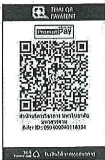
สแกน QR-Code เพื่อชำระค่าลงทะเบียน