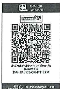
สแกน QR Code เพื่อชำระค่าลงทะเบียน