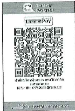
หมายเลข QR Code เพื่อชำระค่าลงทะเบียน