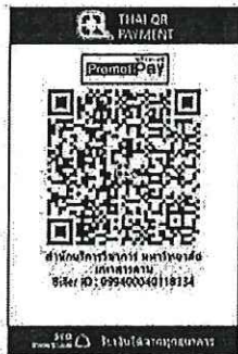
สแกน QR Code เพื่อชำระค่าลงทะเบียน

๔.๒ “สแกน QR Code” ผ่านทางแอปพลิเคชัน Mobile Banking