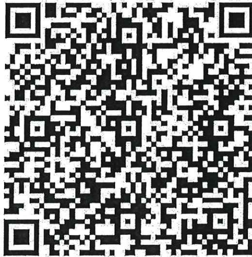
สมัครอบรม