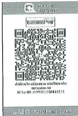
หมายเลข QR Code เพื่อชำระค่าลงทะเบียน