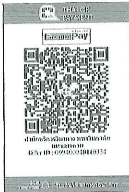
สแกน QR Code เพื่อชำระค่าลงทะเบียน