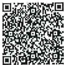
สแกนสมัครอบรม