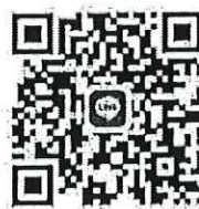
สแกนส่งหลักฐานการชำระค่าลงทะเบียนและสอบถามข้อมูลเพิ่มเติม