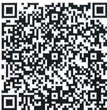
สมัครอบรม