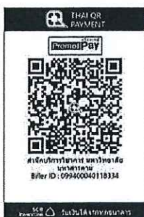
สแกน QR Code เพื่อชำระค่าลงทะเบียน