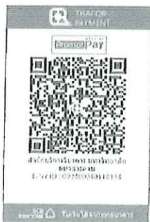
THAI QR Code เพื่อชำระค่าลงทะเบียน

๑๐.๒ โอนชำระด้วยวิธี “สแกน QR Code” ผ่านทางแอปพลิเคชัน Mobile Banking