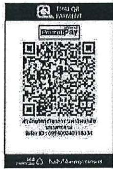
แถม QR Code เพื่อชำระค่าลงทะเบียน