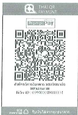
สแกน QR Code เพื่อชำระค่าลงทะเบียน

๔.๒ โอนชำระด้วยวิธี “สแกน QR Code” ผ่านทางแอปพลิเคชัน Mobile Banking