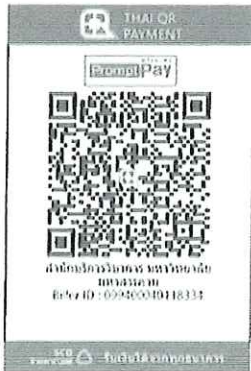
ภาพ QR Code เพื่อชำระค่าลงทะเบียน

๔.๒ โอนชำระด้วยวิธี “สแกน QR Code” ผ่านทางแอปพลิเคชัน Mobile Banking